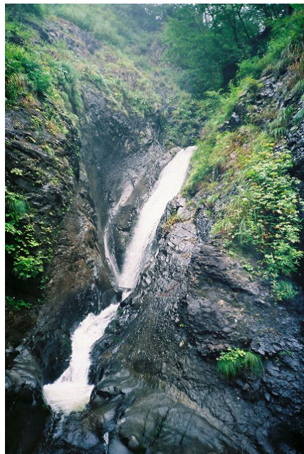
童人トマ F1:いきなり迫力の20m 滝