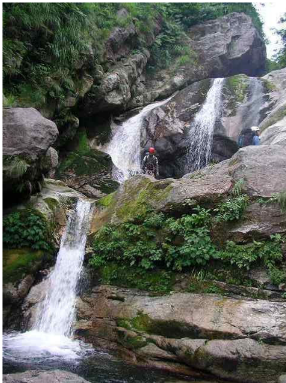
タテヒビ沢手前の連瀑帯

本日の行動は、車の回収も含め少々長いので5:40に出発する。ゴーロが終わると10m滝が現れ、手前の右岸ルンゼより巻く。続くチムニー滝8mも手前のルンゼ状より小さく巻く。権ノ神岳からの沢が右より3:1で合わさると、10mハング滝を最下段に持つ多段の滝が現れる。ここは先ほどの沢を少し登り、まとめて巻く。4m滝、樋状3条8m滝を登り、10m滝を左岸より巻くと4m滝の懸かるタテヒビ沢と出会う。