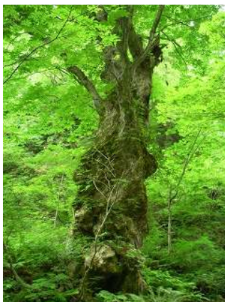
トロが住んでいそうなトチの巨木

ちょっとした淵と小滝を越えるとほどなく二又へ到着。大平には幅広の滝がかかっている。銚子洞に入り少し進んだところでよい川原があったのでここを天場とする。すぐ先には遠めにもはっきりとわかるほど巨大なトチの木が見えている。思わず荷物を置いて近寄ってみると、はたして今まで見たこともないほどの大きさだった。こんな大木に出会えただけでも幸せだ。