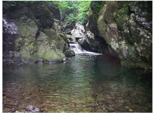
水は澄んでとても綺麗

ちょっとした淵と小滝を越えるとほどなく二又へ到着。大平には幅広の滝がかかっている。銚子洞に入り少し進んだところでよい川原があったのでここを天場とする。すぐ先には遠めにもはっきりとわかるほど巨大なトチの木が見えている。思わず荷物を置いて近寄ってみると、はたして今まで見たこともないほどの大きさだった。こんな大木に出会えただけでも幸せだ。