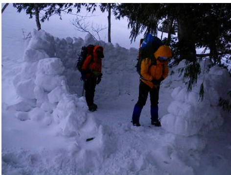
力作のブロック塀（翌朝の状態）