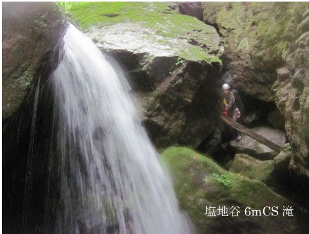
塩地谷 6mCS 滝