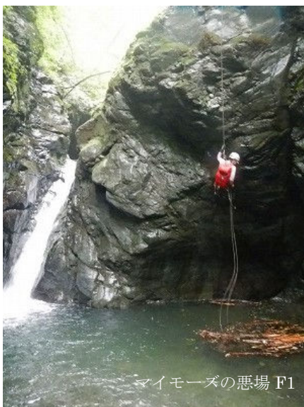
マイモーズの悪場 F1