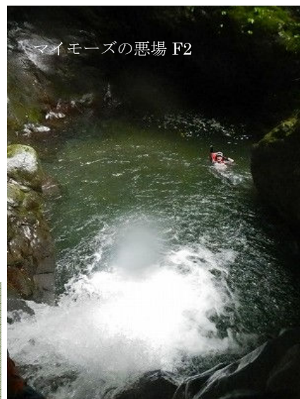
マイモーズの悪場 F2