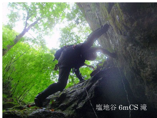
塩地谷 6mCS 滝