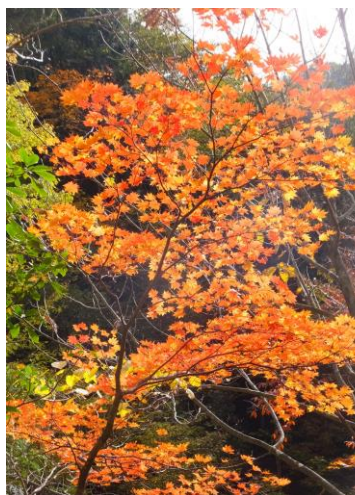
ここにも、秋ですなあ～