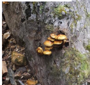
もひとつおまけに