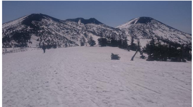
田茂谷地岳頂上から右奥の大岳を目指す

田茂谷地岳にロープウェイを使って登る。スキーをかついで先のピークへ行き、そこからまずは大斜面の滑降。ザラメが気持ちいい。カミさんはといえば、久しぶりの山スキーに慣れない様子。昨年今年とスキーの腕は結構上げたのだが、まあ勝手が違うのもやむをえまい。