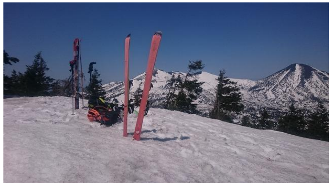
穏やかな猿倉岳山頂

滑降は猿倉温泉を目指す。傾斜は緩く、つつい右に行ってしまうがちなのを、何とか左に修正しながら滑っていく。やがて浅い沢を越えた右手の中間尾根に入り、そこを滑ると最後沢を渡って猿倉温泉に到着。バスの時間まで大分あったがのんびりと過ごした。