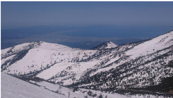
大岳の登りから青森湾が見える

面を小屋の上まで、そこから左にルートを取る。やがて地図にもある大湿原に行く。ここでルートを間違えてしまった。もっと左へトラバースして大岳環状ルートに乗らないといけなかったのだが、そのまままっすぐに行ってしまった。おかげで急斜面のヤブに突き当たるわ、最後は結構なアップ