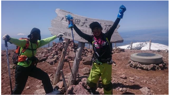
大岳山頂には雪がなかった

酸ヶ湯温泉上部の大斜面を滑って、酸ヶ湯に滑り込んで終了。バスでロープウェイ駅に戻った。バスは以前のように便が多くな、ちゃんと時間を読みながらの行動をしないとイケなかった。これは今後も要注意だ。